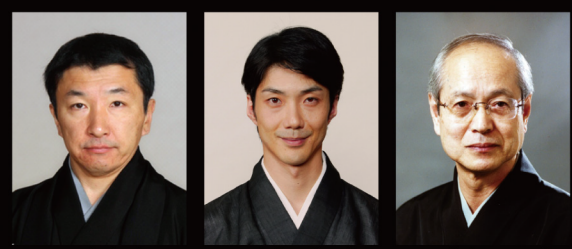
山階彌右衛門 野村萬齋 野村万作